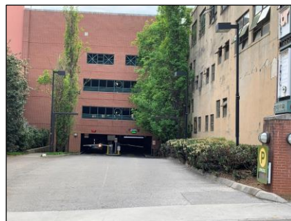
Walnut St (este) entrada del Parqueo de Locust