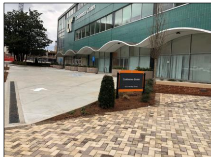
Parqueo en la Plaza

Si los espacios están llenos, salga del estacionamiento de la plaza y gire a la izquierda en Church St. En la intersección de Walnut St., gire a la izquierda y conduzca aproximadamente dos cuadras en Walnut St. para encontrar la entrada este (trasera) del parqueo en Locust